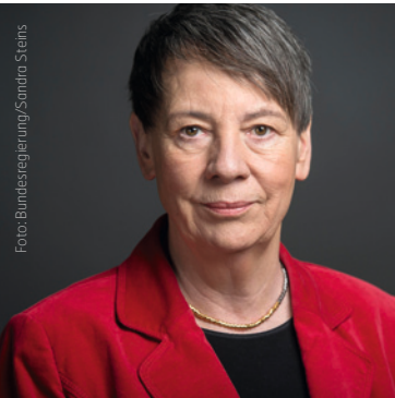
Dr. Barbara Hendricks

Bundesbauministerin für Umwelt, Naturschutz, Bau und Reaktorsicherheit